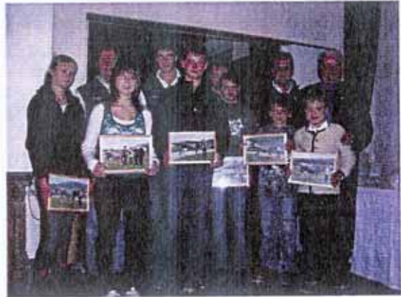
Eine Gruppe von ausgezeichneten Jungzüchter/innen.